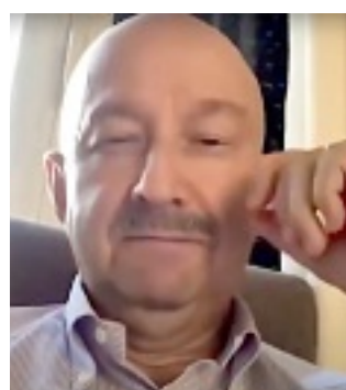
El ex Presidente Carlos Salinas de Gortari.